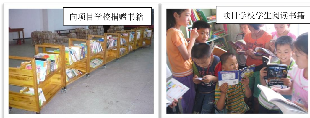
图 3 好书捐赠，学生阅读

第一阶段（2007-2009 年）：好书大家读——认识好书。 此阶段的项目目标是让成人认识和理解什么是优质的童书、童书的不同种类、图画书的意义，及一本好的童书最大的价值是被人翻阅而非“妥善的保管”。围绕该目标，此阶段基金会的活动以书籍捐赠为主，为项目学校配置高质量的儿童读物。