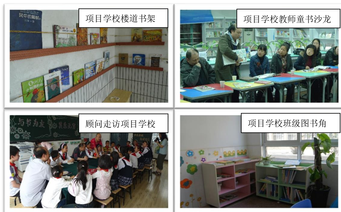
图 4 图书馆中的学校

问，主要围绕模型的“人、书、时间”三要素，为项目学校提供班级图书角的新书配置、教师培训（集中进行阅读理念培训和教师童书培训）及项目顾问实地走访指导三方面的支持。