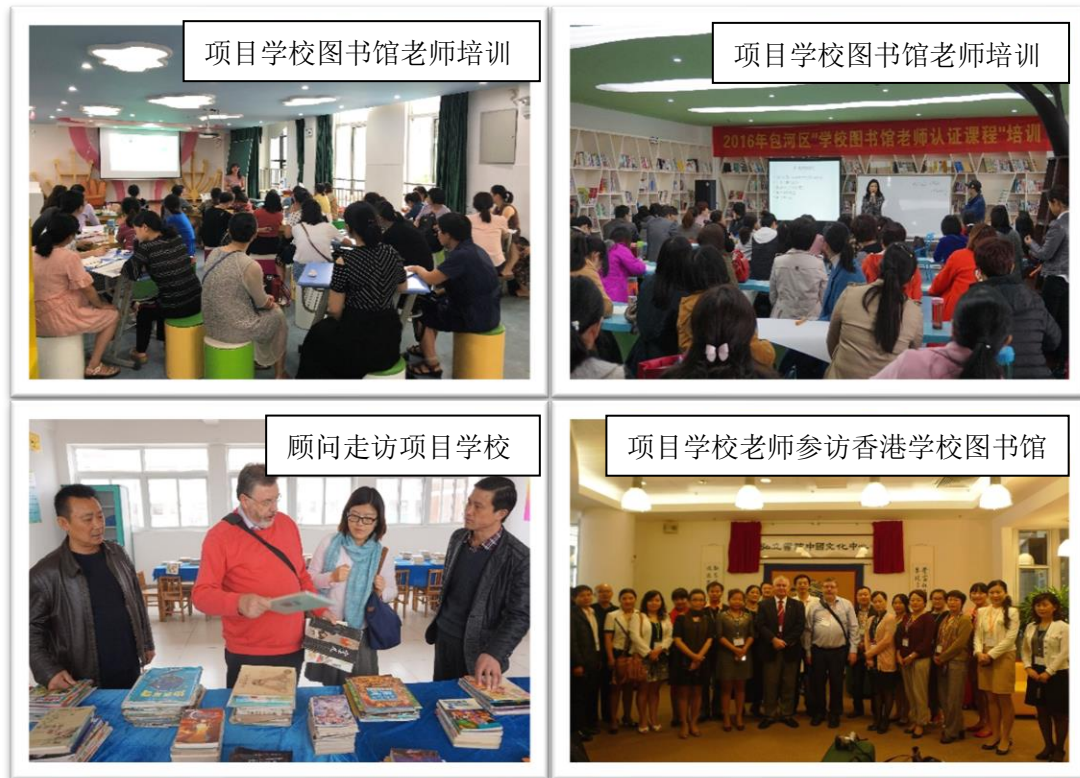
图 5 学校的图书馆

需要特别强调是，在很大程度上，HFP 的发展阶段和发展路径与当时的经济、政治、社会理念和文化发展有关。十多年前，我国内地的优质童书和图画书的出版才刚刚起步，“自主阅读”和儿童阅读的概念对绝大多数人是一个舶来品，教育经费的投入与现在也不可同日而语。因此，项目的重点放在“认识好书”上，以便为下一个阶段的发展打下坚实的基础。而现在，随着童书出版行业的蓬勃发展，政府、民间等不同机构都参与到儿童阅读推动工作，社会对当代教育具有创新的理解，发展“校园自主阅读模型”的新学校可以做到起步高、发展快，在整合三个阶段的重点的基础上制订校园快乐阅读文化建设的执行策略。